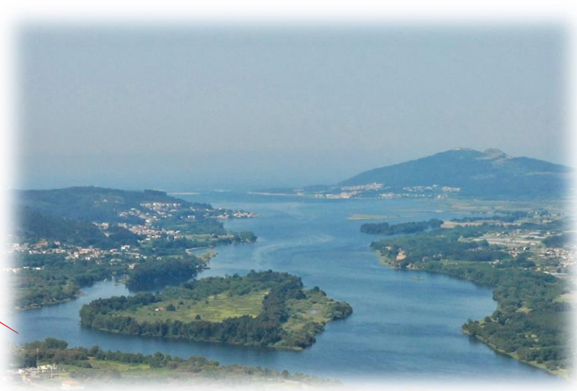
Estuário do rio Minho