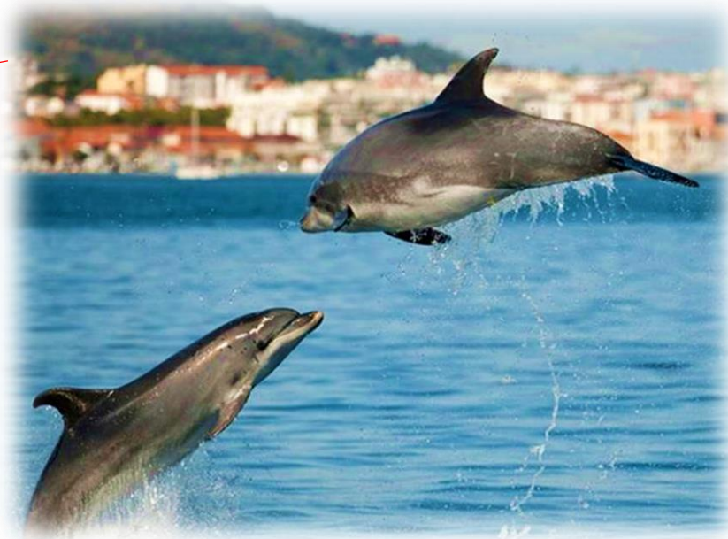
Estuário do rio Sado