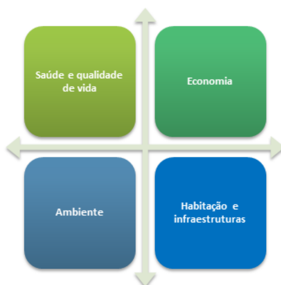
Figura 3. Modelo de organização temática dos trabalhos.

Os trabalhos serão realizados em estreita e permanente articulação com o município de Almodôvar e irão organizar-se em quatro grandes áreas coordenadas de forma independente, mas devidamente articuladas, de modo a garantir a coesão da Estratégia. Estas quatro grandes áreas traduzem as áreas de competência nas quais o município de Almodôvar poderá ter uma intervenção mais concreta na promoção da adaptação local às alterações climáticas (Figura 3).