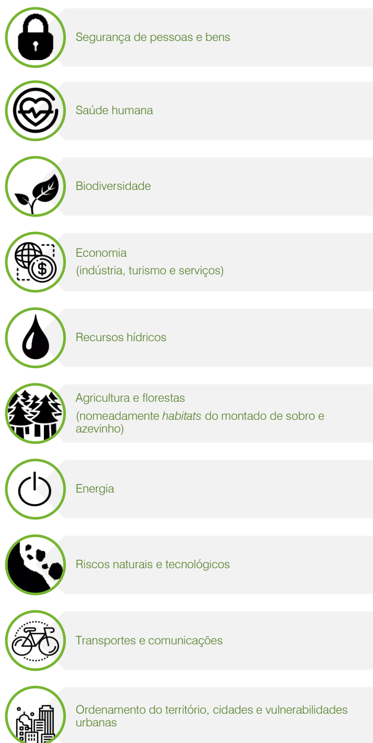
Figura 4. Setores prioritários considerados prioritários para a região do Baixo Alentejo.