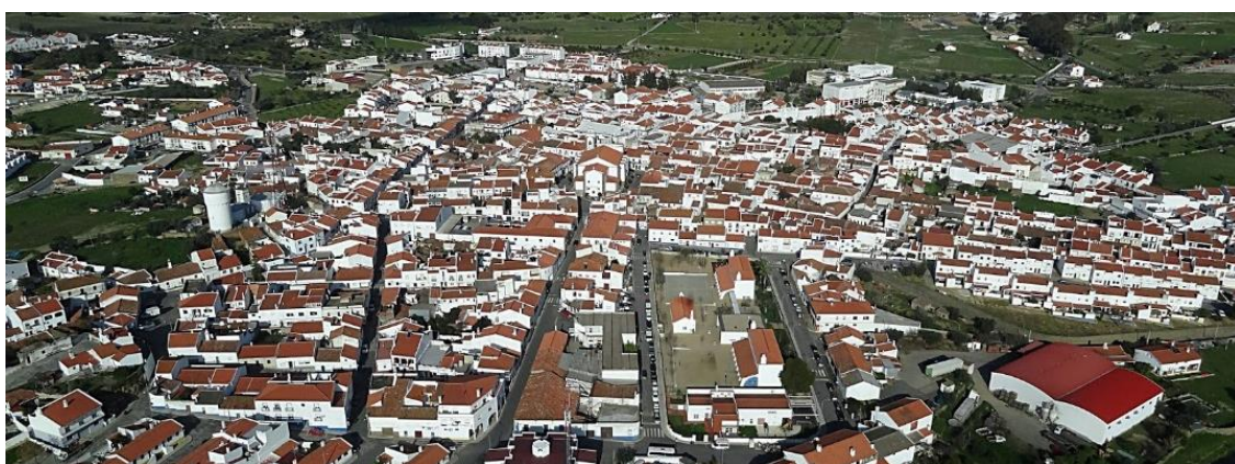
Figura 1. Vista aérea de Almodôvar.