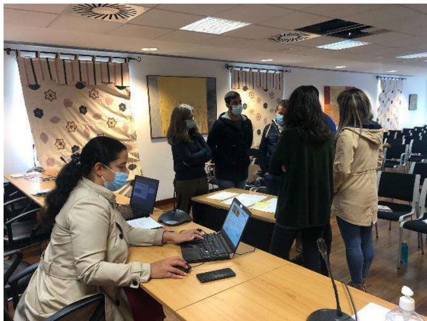
Imagem 2 – Workshop III (25.nov.2021)